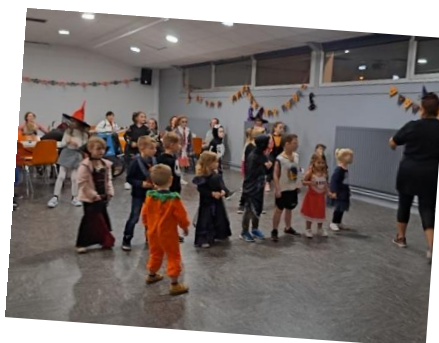
RAI : soirée Halloween