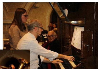
Concert Inauguration de l'orgue