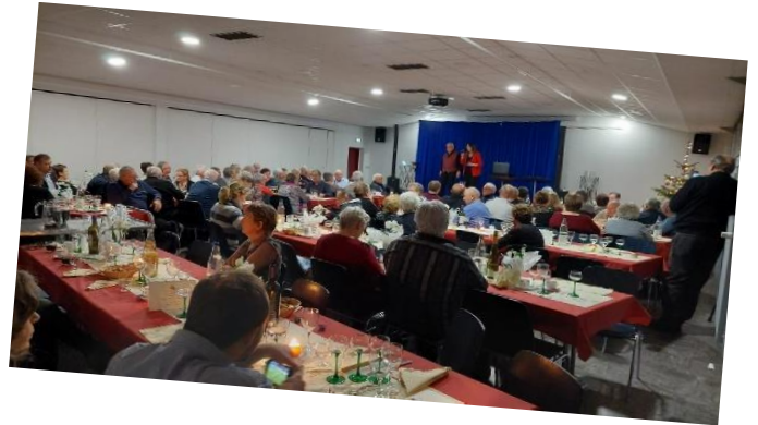
Repas de Noël des Aînés