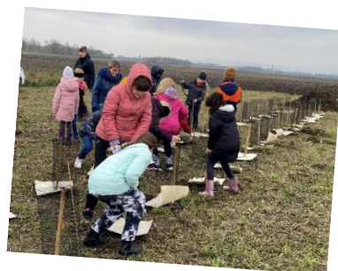
Ecole : plantation d'une haie vive