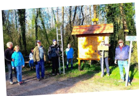
ANPOE : entretien du sentier botanique