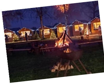
APP / Noël au bord de l'eau