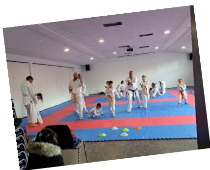
Karaté Nippon Kempo Kyokai