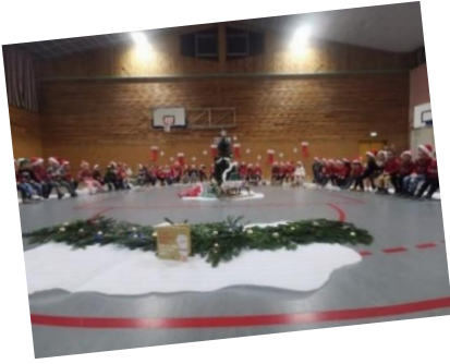
Ecole et APEO : Fête de Noël des Maternelles