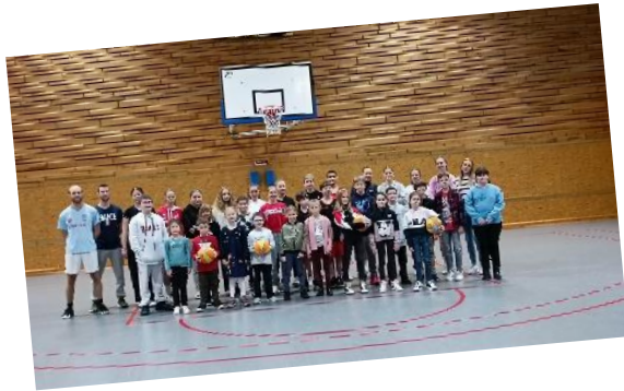
Basket : stage de Noël