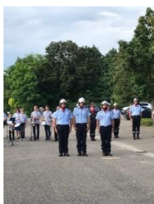
14 juillet avec la batterie-fanfare