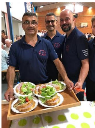
SP : soirée Pâté en croûte