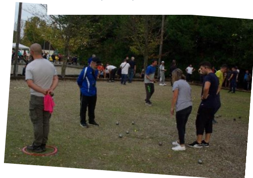
Tournoi de pétanque 1