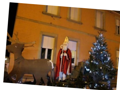
Saint Nicolas des Sapeurs-Pompiers