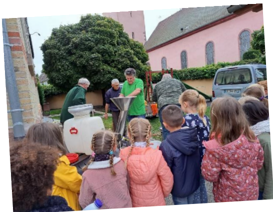
Association Obstgarde - Atelier Jus de Pommes à l'école

Nous adressons notre reconnaissance aux associations, aux bénévoles de la médiathèque et aux enseignantes pour tout ce qu'elles organisent tout au long de l'année pour le bien-être des enfants et de la population. Merci à vous de les soutenir en participant à leurs actions qui seront annoncées au fur et à mesure dans les notes d'information et sur les réseaux sociaux.