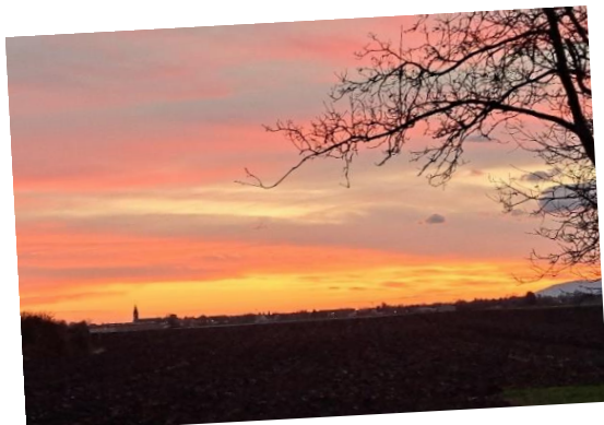
Merveilles de la nature