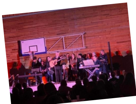
Concert organisé par la Jeunesse indépendante chrétienne (JIC)